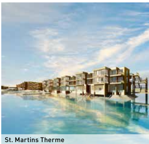
St. Martins Therme