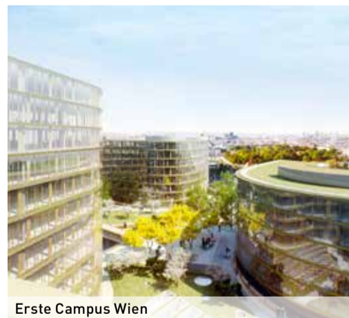
Erste Campus Wien